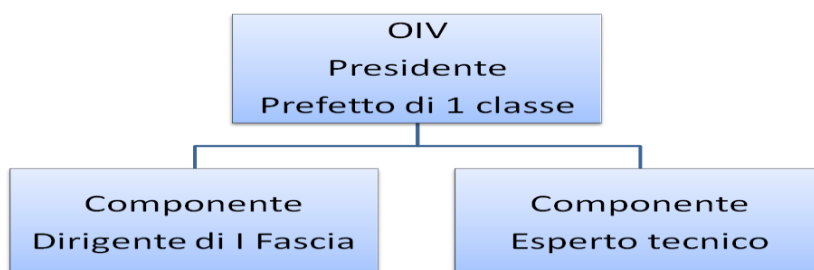
Figura 3: Organigramma dell'Organismo Indipendente di Valutazione della Performance

Tale scelta comporterà, per il susposto principio dell'invarianza della spesa, il taglio di 2 posti nella dotazione organica dei dirigenti di II fascia.