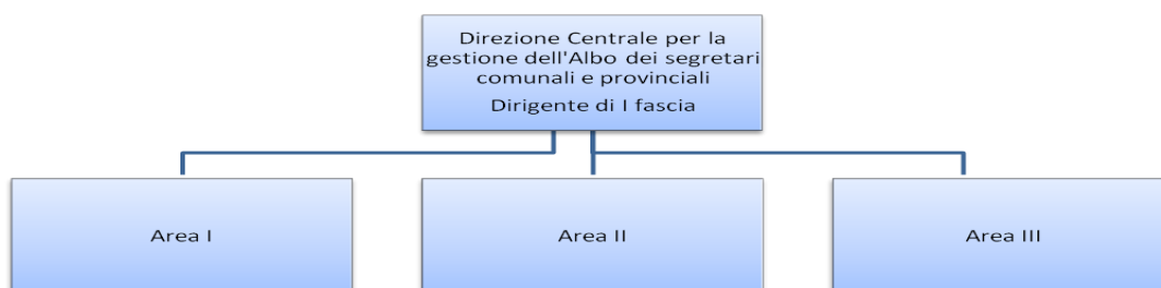
Figura 4: Organigramma della Direzione Centrale per la gestione dell'Albo dei Segretari Comunali e Provinciali

Anche sotto l'aspetto economico la stessa legge prevede la copertura delle spese con la riduzione dei trasferimenti alle amministrazioni provinciali e comunali quindi tale soluzione non comporterebbe nuovi oneri per l'amministrazione.