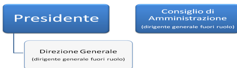
Figura 2: Organigramma dei posti di funzione dei dirigenti generali nell'ambito dell'Agenzia Nazionale per l'Amministrazione e la destinazione dei beni sequestrati e confiscati alla criminalità organizzata

Nella figura che segue si evince la possibile struttura dei posti di funzione di livello dirigenziale generale di cui si propone la relativa istituzione, in aggiunta alla dotazione ordinaria della dirigenza di prima fascia dell'Amministrazione civile dell'Interno.